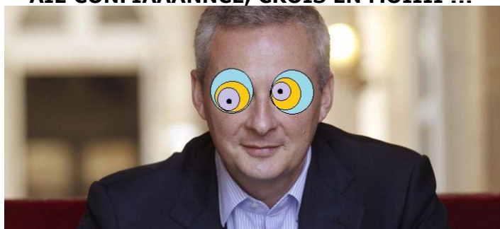
Bruno Le Maire KAA

(NB : malheureusement ce montage photo fonctionne avec plein d'autres personnes et sur plein d'autres sujets)